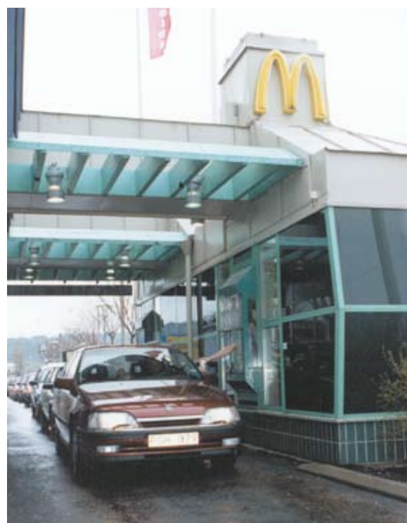
Раздаточное окно, закусочная McDonald's, Стокгольм, AD100